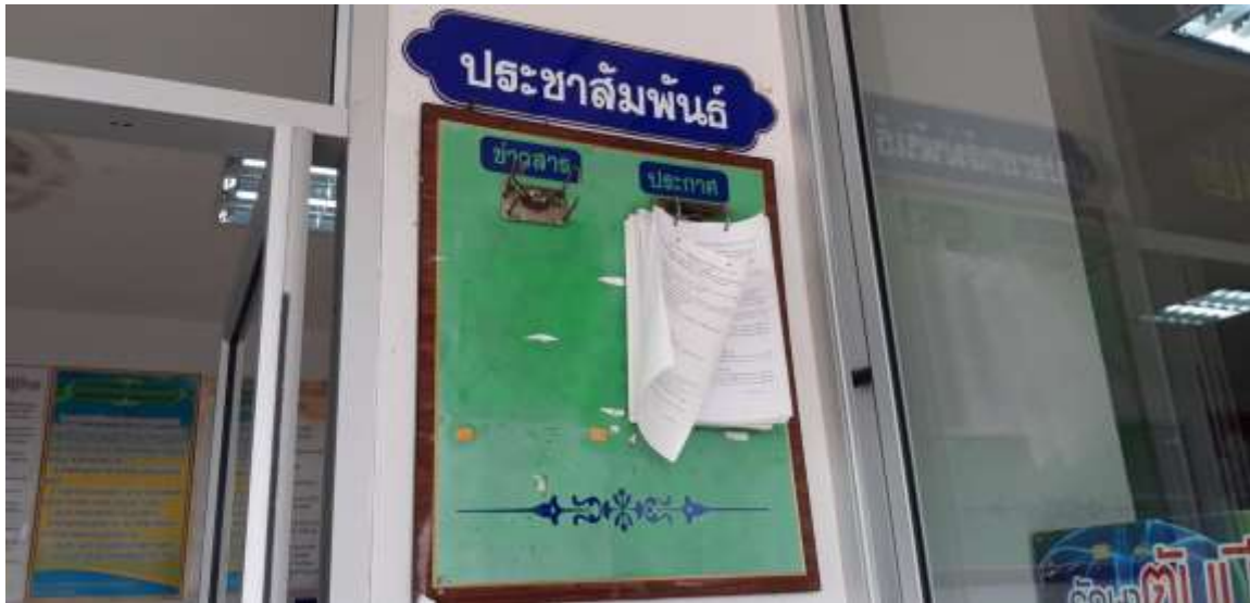
ศูนย์บริการรับเรื่องร้องเรียนในหน่วยบริการ โรงพยาบาลไพบรึง